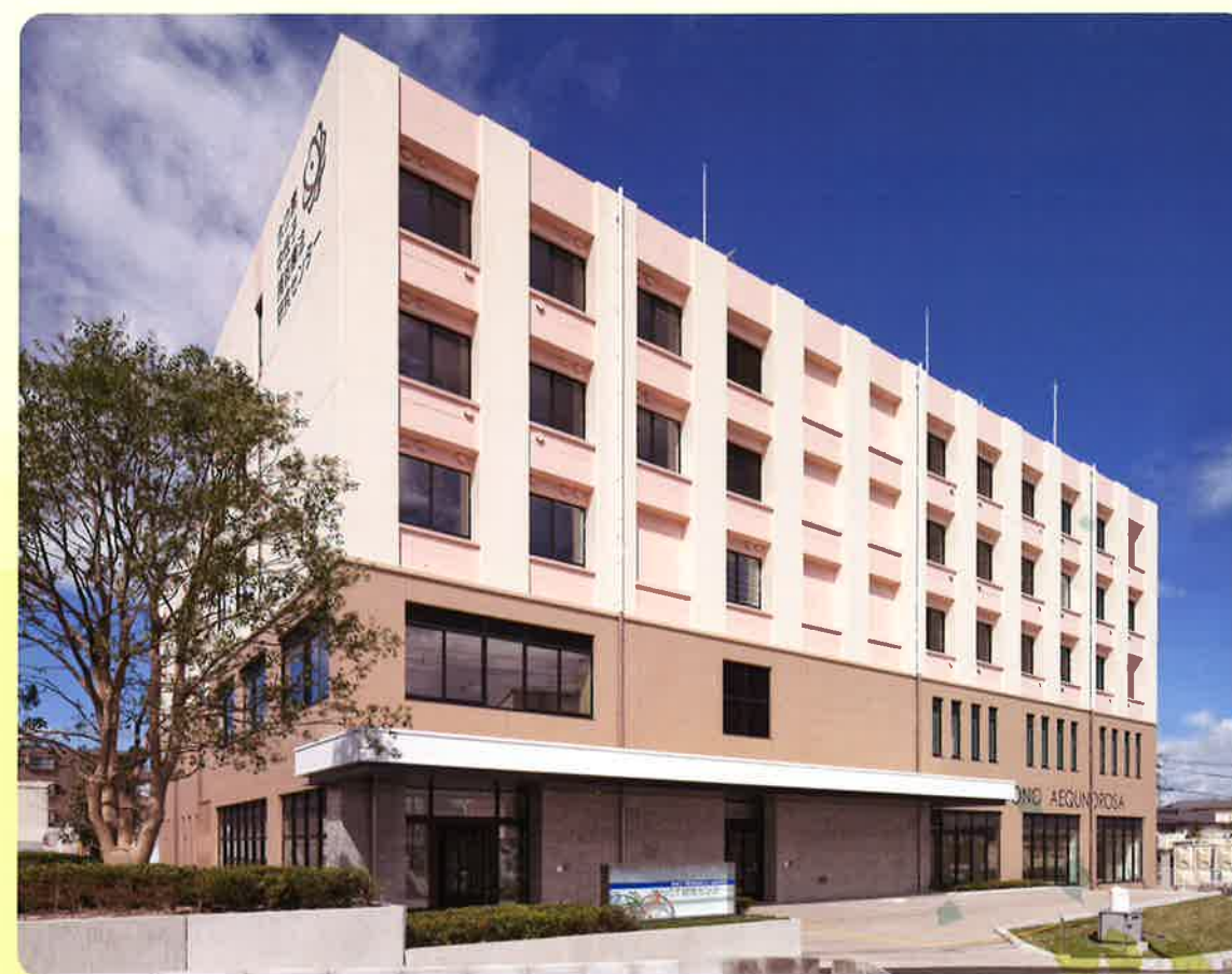
（南東北 BNCT 研究センター内）