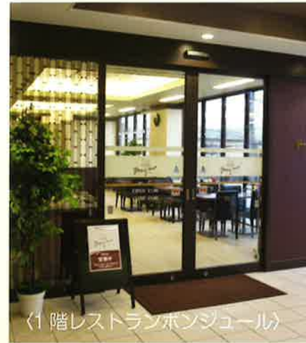
〈1階レストランボンジュール〉